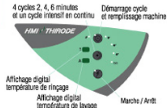
Tableau de commande électronique à affichage digital de la température de l'eau de lavage et de rinçage